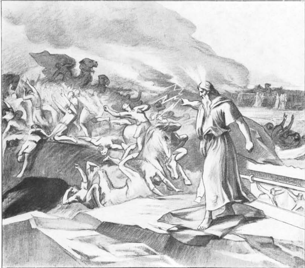
FIG. 5. — LA RÉVOLTE DES HÉBREUX. MOÏSE TIENT TÊTE AUX RÉVOLTÉS ET IL MANIE LA Foudre. LA TERRE S'OUVRE A SA VOIX ET ENGLOUTIT UNE PARTIE DES RÉVOLTÉS. LES AUTRES SONT FRAPPÉS DE LA LÈPRE ÉLECTRIQUE.