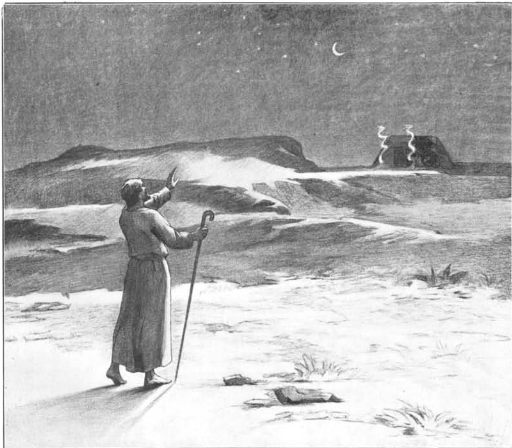
FIG. 5. — APRÈS SA CONDAMNATION MOÏSE A CHOISI LA PLUS DURE DES EXPIATIONS : L'EXIL AU TEMPLE DE JETHRO DONT AUCUN INITIÉ N'A RÉUSSI A SUBIR LES ÉPREUVES. TOUS Y SONT MORTS. MOÏSE ARRIVE LA NUIT EN VUE DE CE TERRIBLE LIEU ET DIT ADIEU A LA VIE.