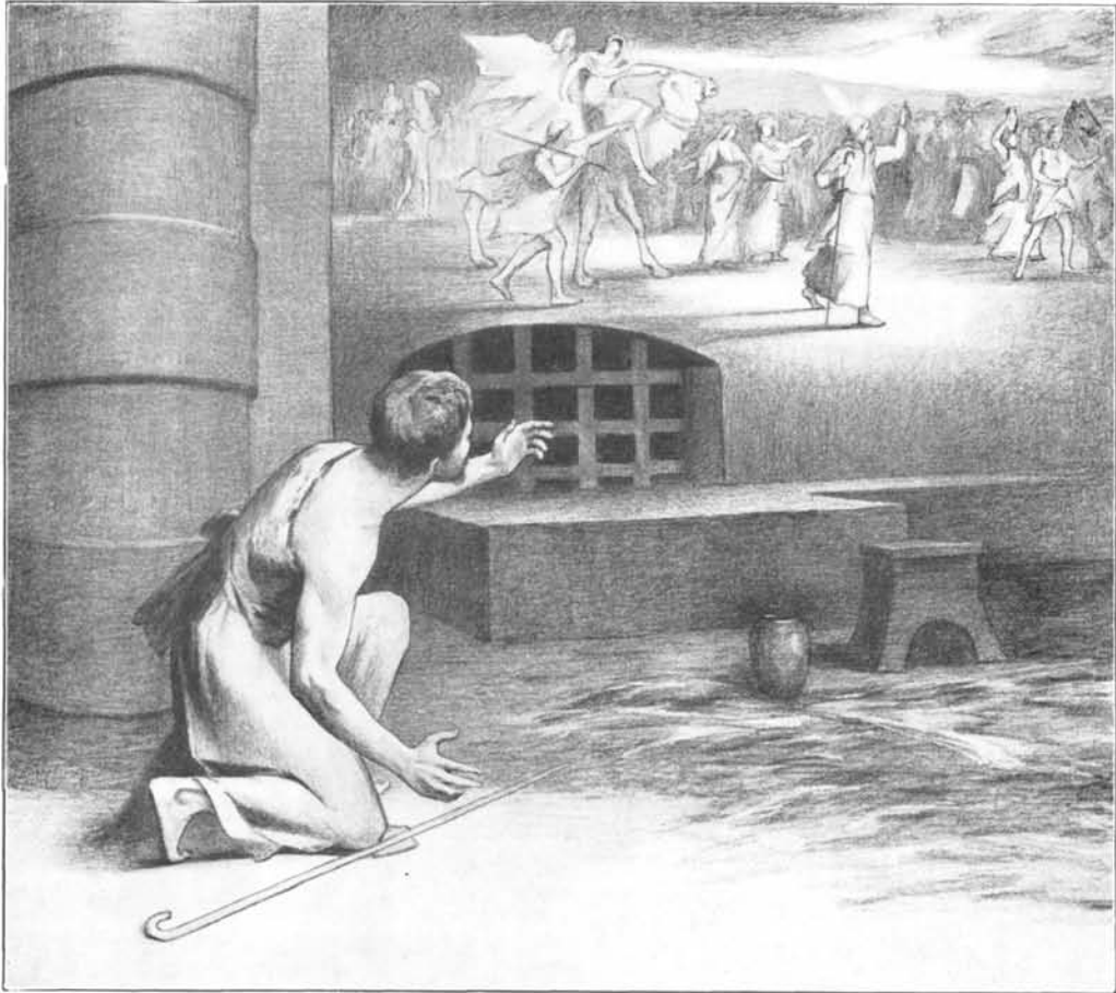
FIG. 2. — APRÈS LE MEURTRE DU SOLDAT ÉGYPTIEN, MOÏSE A ÉTÉ JUGÉ ET CONDAMNÉ. IL EST DANS SA PRISON. LA VIE SEMBLE TERMINÉE POUR LUI ET IL SE DÉSESPÈRE. LE MUR DE LA PRISON S'ILLUMINE ET MOÏSE SE RECONNAÎT ACCOMPLISSANT PLUS TARD SA MISSION.