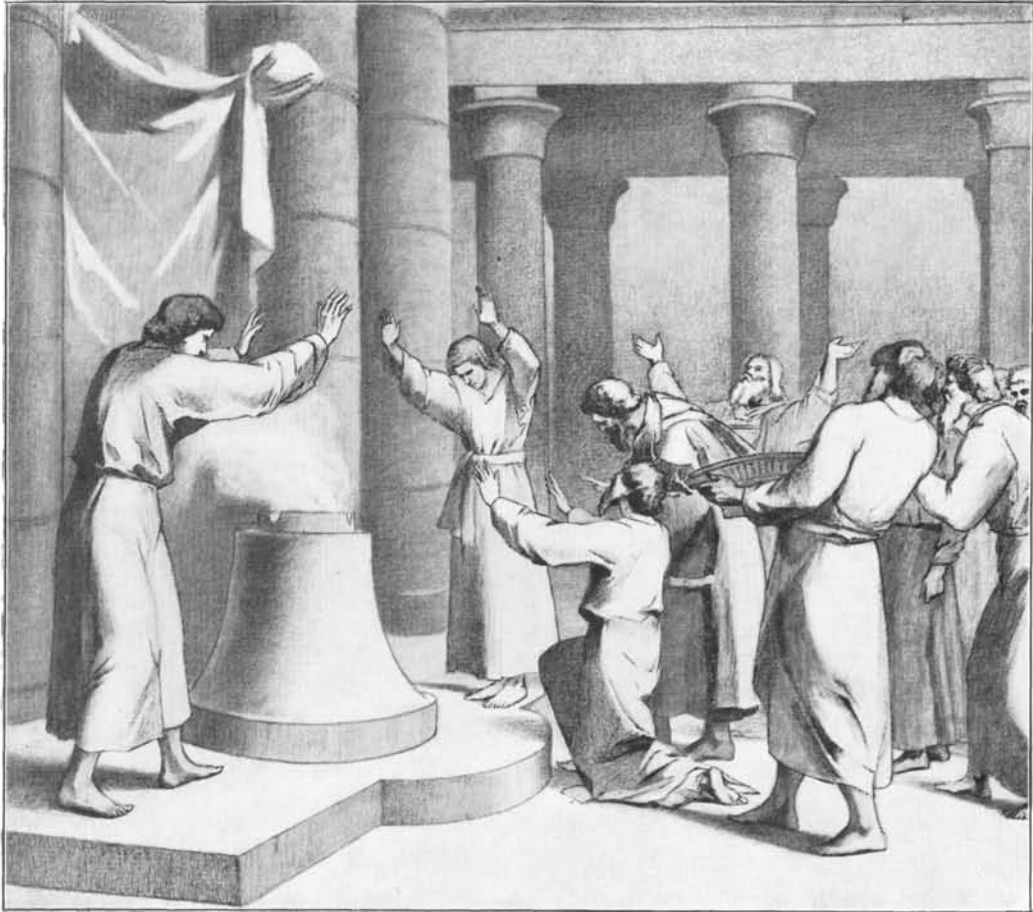
FIG. 1. — MOÏSE ET ORPHÉE ÉTUDIANTS DES MYSTÈRES AU TEMPLE D'ISIS.